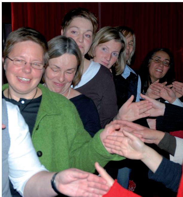
Soziale Kunst muss man üben

C.B.: An erster Stelle wäre hier die Sozial-eurythmie zu nennen, sie begleitete den gesamten Kurs. Das ist eine Eurythmie, die besonders im Arbeitsleben eingesetzt wird, um soziale Prozesse deutlich zu machen und eigenes Verhalten zu reflektieren. Die Teilnehmerinnen waren ausnahmslos berührt und begeistert von den Lernerfahrungen, die diese Eurythmie ermöglichte. Außerdem gab es – neben